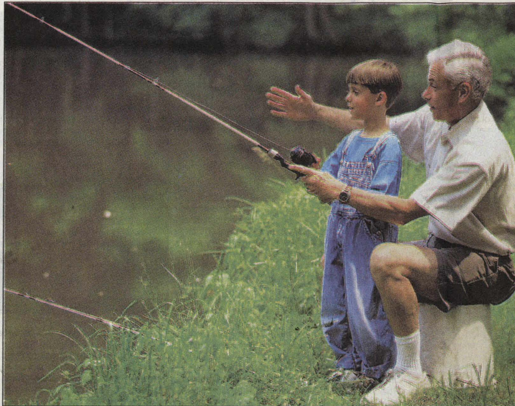
L'Agenda 21 : une démarche pour permettre aux générations futures d'hériter de ressources.

La mise en œuvre d'un Agenda 21 local induit le développement d'une nouvelle « gouvernance », approche